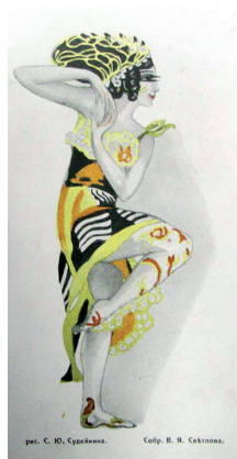
Рис. 7. С.Ю. Судейкин. Рисунок Т.П. Карсавиной для сборника «Букет для Карсавиной» (1914)

Данное издание является посвящением великой балерине. Оно вобрало в себя уникальные рисунки, замечательные стихи, записи и пожелания ярчайших представителей культуры Серебряного века. В сборниках того периода часто можно встретить стихи, посвященные Т.П. Карсавиной, поскольку многие деятели искусства посещали балетные постановки и её творчество не могло не вдохновлять.