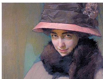
Рис. 5. А. Эберлинг. Портрет балерины Тамары Карсавиной (1911)

С 1930 по 1950 г. Тамара Платоновна являлась вице-президентом Королевской академии танца в Великобритании [6]. Однако в советской истории о ней знал лишь узкий круг специалистов. Интерес к жизни и деятельности представительницы русской культуры конца XIX – начала XX в. в современной России вновь возрождается.