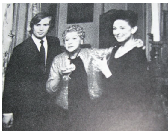
Рис. 8. Фотография Т.П. Карсавиной с С.Р. Нуриевым и М. Фонтейн

Память о Тамаре Платоновне сохранялась многие годы: как самой балериной через художественное и балетное наследие, так и людьми, так или иначе входившими в её ближний круг. Но всё это было только при её жизни. В СССР эмигрировавшую за рубеж балерину практически забыли. Лишь изредка её имя мелькало в печати, хотя в Лондоне в 1968 г. 80-летие выдающейся актрисы широко отмечалось (см. рис. 8). Однако за её могилой, которая находится в Великобритании, долгие годы никто не ухаживал. И только в 2016 г. её начали восстанавливать руководители «Русского наследия в Великобритании».