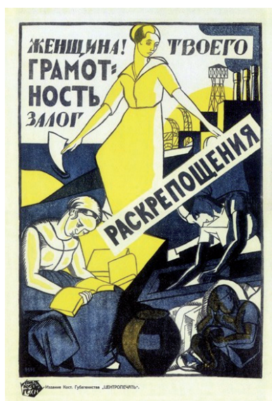
Рис. 1. Плакат Наталии Сергеевны Изнар «Женщина! Грамотность — залог твоего раскрепощения»

Плакат Наталии Сергеевны Изнар «Женщина! Грамотность — залог твоего раскрепощения» (см. рис. 1) ярко демонстрирует изменения в положении женщины, движение из прошлого в будущее. Женщины прошлого изображены в правом нижнем углу, это — самое темное место плаката. Они обременены своими повседневными заботами: детьми и домом. Женщина настоящего изображена внизу слева, на самом светлом месте. Она также показана склонившейся над трудной работой, но эта работа — чтение, освоение грамотности, образование. Склонившаяся над книгой женщина как бы освещена сиянием, исходящим от книги. В центре композиции изображена женщина будущего, которая возвышается над своими соратницами. Она свободна, ее спина прямая, её руки не обременены тяжёлой работой, а за ней возвышаются трубы заводов и фабрик, воплощающие будущее, в котором труд будет механизирован. Такой видели женщину будущего художники 1920-х годов — раскрепощенную, будто светящуюся сочетанием желтого и белого цвета [13, с. 169].