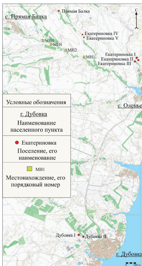
Рис.1. Карта-схема мест расположения поселений эпохи поздней бронзы в Дубовском районе Волгоградской области