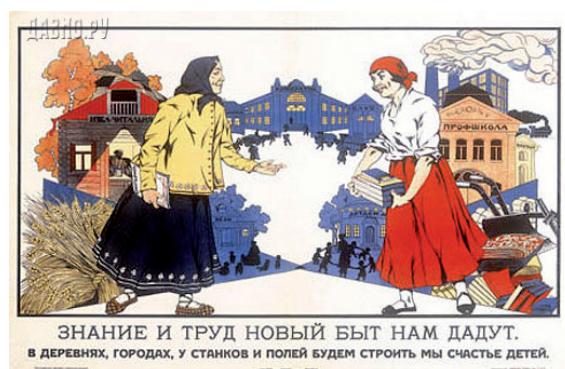
Рис. 4. Плакат Л. Емельянова «Знание и труд новый быт нам дадут...»

Советское общество и государство наделило женщину новой социальной функцией, вынуждая её быть активной. Нередко она встречается в роли агитатора и пропагандиста, как, например, в плакате И.П. Макарычева и С.Б. Раева «Каждая кухарка должна научиться управлять государством!» 1925 г. (см. рис. 5). Композиция данного плаката символична: на темном фоне изображен круг с изображением Совета, словно лучом прожектора высвечено здание, символизирующее государство, над которым возвышается фигура работницы им управляющей. Наружность женщины монументальна и андрогенна [13, с. 172].