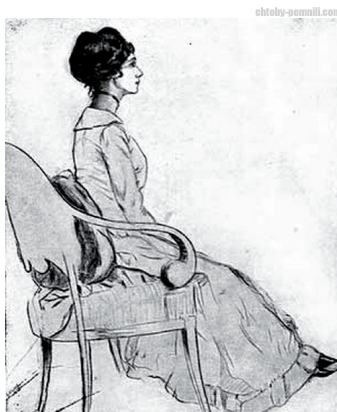
Рис. 4. Г.Д. Брюс. Портрет Т.П. Карсавиной (1918)