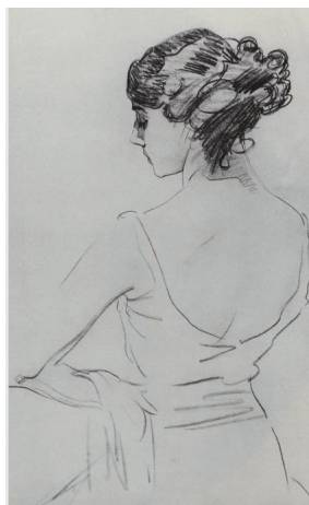
Рис. 2. В.А. Серов. Портрет балерины Карсавиной (1909)

Известные художники рисовали портреты Т.П. Карсавиной: В.А. Серов (1909) (см. рис. 2), С.А. Сорин (1910) (см. рис. 3), А. Эберлинг (1917) (см. рис. 5), её супруг – английский дипломат Г.Д. Брюс (1918) (см. рис.4.) и др.