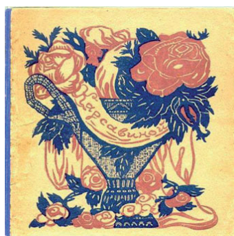
Рис. 6. Переплет книги «Букет для Карсавиной» (1914)

«Тамаре Платоновне Карсавиной» называется сборник, приуроченный ко дню рождения Т.П. Карсавиной и изданный 26 марта 1914 г. Балерину пригласили в литературно-артистическое кабаре «Бродячая собака», где попросили исполнить импровизационный танец. После выступления ей вручили книгу «Букет для Карсавиной» (см. рис. 6).