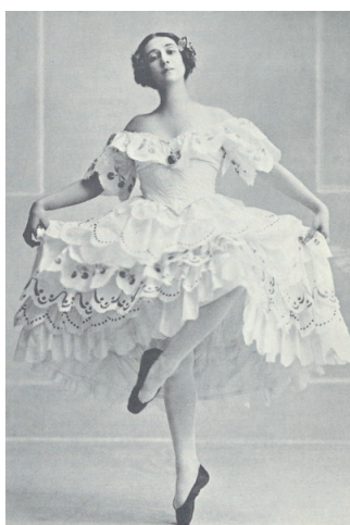
Рис. 1. Фотопортрет Т.П. Карсавиной

Следующая статья через источники личного происхождения характеризовала образ Тамары Платоновны Карсавиной (см. рис. 1), выдающейся балерины XX в., ведущей артистки Мариинского театра, исполнившей практически весь классический балетный репертуар [5, с. 53–58].