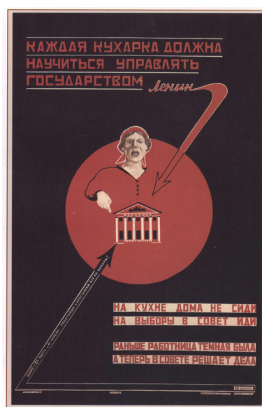
Рис. 5. Плакат И.П. Макарычева и С.Б. Раева «Каждая кухарка должна научиться управлять государством!» 1925 г.

Советское общество и государство наделило женщину новой социальной функцией, вынуждая её быть активной. Нередко она встречается в роли агитатора и пропагандиста, как, например, в плакате И.П. Макарычева и С.Б. Раева «Каждая кухарка должна научиться управлять государством!» 1925 г. (см. рис. 5). Композиция данного плаката символична: на темном фоне изображен круг с изображением Совета, словно лучом прожектора высвечено здание, символизирующее государство, над которым возвышается фигура работницы им управляющей. Наружность женщины монументальна и андрогенна [13, с. 172].