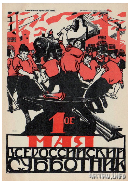
Рис. 3. Плакат Д. Моора «1-ое Мая – Всероссийский субботник»

Женщина-работница 1920-х годов, представленная на плакатах тех лет, довольно аскетична. Пример тому может служить знаменитая пролетарка А. Страхова-Браславского «Раскрепощенная женщина, строй социализм!» (см. рис. 2 на с. 60). Образ словно отлит из стали. Женщина обрисована крупным планом на фоне труб заводов и солнечного диска, воплощающих будущее, в скромной, почти мужской косоворотке, спокойна и сосредоточена, уподоблена скульптуре. Центральным атрибутом образа является косынка, красное знамя и дымящие трубы фабрик. Но в этой героине нет ничего женственного, отсутствуют черты мягкости, женственности, нежности, материнства. Сосредоточенное, серьезное, не улыбающееся выражение лица, отсутствие косметики и украшений – таковы существенные внешние признаки, которыми обладают изображения женщин, позиционируемых как «новый образ». На лице читается внутренняя сила и убедительность, что позволяет приблизить ее к мужским героическим персонажам. Так, например, на плакате Д. Моора «1-ое Мая – Всероссийский субботник» (см. рис. 3) мы видим мужчину и женщину, работающих в кузнице: он занёс молот для удара, она держит щипцами кусок раскаленного железа. На заднем фоне изображены фабричные здания, фигуры других рабочих, паровоз. Оба главных персонажа плаката обладают одинаковой физической мощью, но их роли остаются неизменными. Мужчина – главный (женщина допущена в мужской мир, олицетворяемый кузницей, но только в качестве помощника) [13, с. 170].