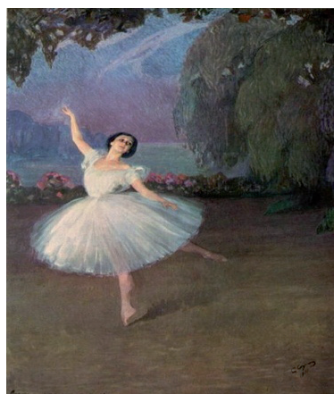
Рис. 3. С.А. Сорин. Тамара Карсавина в балете Сельфида (1910)

Известные художники рисовали портреты Т.П. Карсавиной: В.А. Серов (1909) (см. рис. 2), С.А. Сорин (1910) (см. рис. 3), А. Эберлинг (1917) (см. рис. 5), её супруг – английский дипломат Г.Д. Брюс (1918) (см. рис.4.) и др.